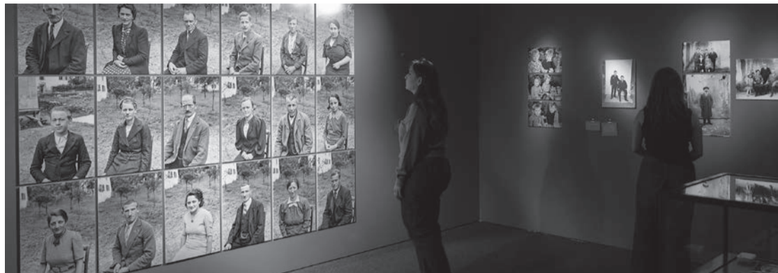
Un regard actuel sur les visages de l'époque.

d'ailleurs ce qui les marque le plus lors de leur visite... le manque de naturel des protagonistes, surtout pour les photos d'avant-guerre... tout était mis en scène et soigneusement étudié pour un meilleur rendu... et le noir et blanc qui accentue le sérieux des images présentées... Souvent, ils arrivent avec quelques préjugés, leur intérêt est mitigé... nous leur donnons des missions à accomplir et au fil de la visite leur attitude change, ils y découvrent des histoires de vie quelques fois surprenantes tels les anciens bains publics sis sur le lieu de la piscine actuelle qui accueillait hommes et femmes, mais à des heures différentes... Ces bains étaient approvisionnés avec l'eau de la Sorne voisine... ce qui leur semble bien curieux... ou encore de jeunes enfants qui, lors d'un défilé, font de la publicité pour les cigarettes Parisienne! »