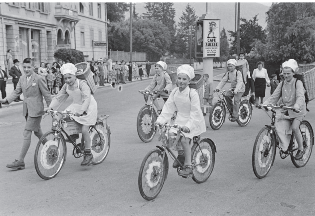
Fête des enfants de la paroisse catholique de Delémont. Cortège de 1949 sur le thème du pain.

Merci aux annonceurs qui font vivre ce journal!