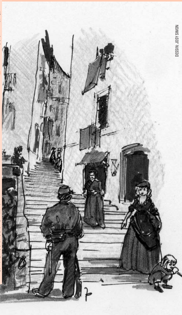
DESSIN: JOSY SIMON

Après le spectacle, le spectacle continuera. La guinguette «Chez Cosette», sous les arcades de l'hôtel de ville, tenue par les organisateurs des Jardins, n'aura été ouverte qu'avant les représentations. Après les applaudissements, c'est de rue en rue et de bistrot en bistrot que la fête se poursuivra, dans la plus chaleureuse des ambiances. Et on peut imaginer que durant la journée aussi, le matin, l'après-midi, et pendant un mois, le petit Paris delémontain connaîtra une belle animation, dans ses rues, dans ses bistrots et dans ses commerces.