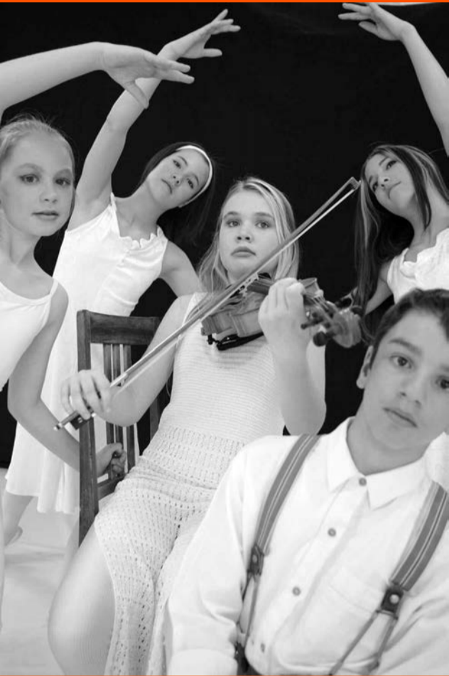
LES QUATRE SAISONS, DE VIVALDI

Un cœur en silence, sur une musique de Vincent Bouduban et un texte de Pascal Rebetez, extraits d'un ballet contemporain, présenté déjà en 1997, avec 8 danseuses du Ballet de l'Ambre.